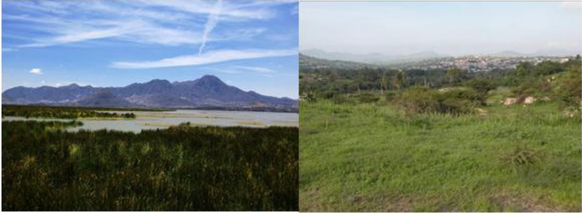
Imagen 3. Lago de Cuitzeo y mirador en Charo.